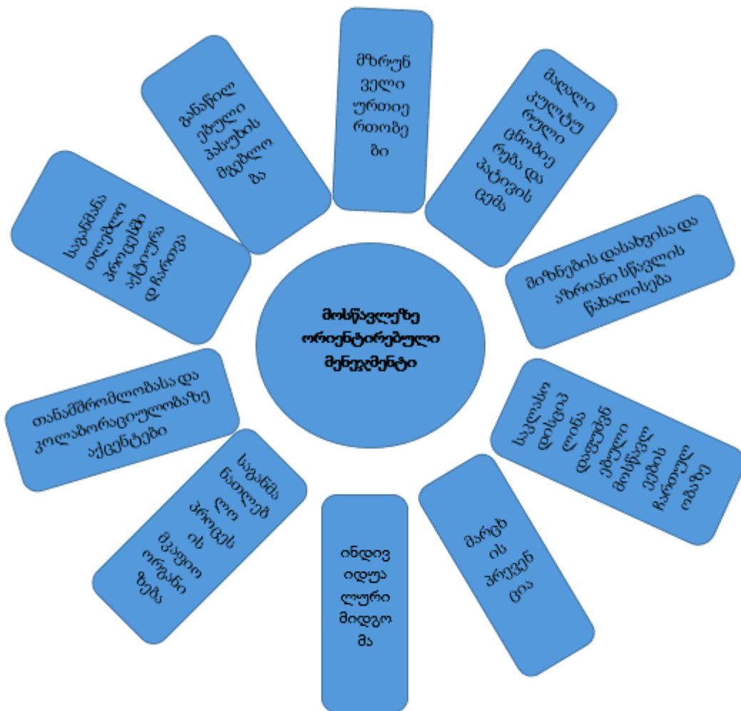
ფიგურა 1.2. მოსწავლეზე-ორიენტირებული საკლასო მენეჯმენტის ხელშემწყობი ფაქტორები

გაზიარება და ჯანსაღი კომუნიკაცია; 2) მოსწავლეების მხრიდან მზაობა აიღონ პასუხისმგებლობა საკუთარ სწავლაზე და გააცნობიერონ საკუთარი როლი ამ პროცესში; 3) მასწავლებლის მხრიდან დახმარება მოსწავლეების, რათა მათ დამოუკიდებლად შეარჩიონ სასწავლო სტრატეგიები და იყენენ ავტონომიური უნარებით აღჭურვილნი. ეს ილუსტრირებულია ქვემოთ მოცემულ ფიგურაში.